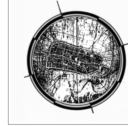
Grafico e Sint. Informativo del Servizio Pianificazione Urbanistica