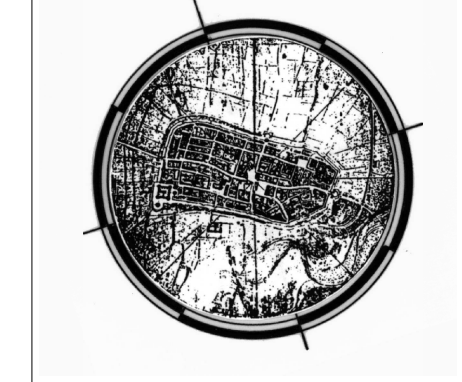
Grafico e Sint. Informativo del Servizio Pianificazione Urbanistica

ADDEZIONE del C.C. 137 del 29/04/1999 OSSERVAZ. E CONTRODETERMINAZIONI del C.C. 104 del 10/04/01 APPROVAZIONE del Piano G.P. 488 del 17/12/2001 Via Fontazza Scala 1 : 5000 Foglio 03