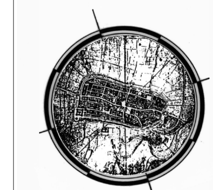
Grafico e Sivi Informativo del Servizio Pianificazione Urbanistica

Via Casola Canina Scala 1:5000 Foglio 07