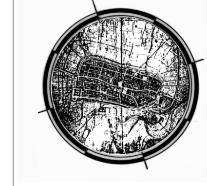
Grafico e Sint. Informativo del Servizio Pianificazione Urbanistica

Adozione: delibera C.C. n° 137 del 29.04.1999 Creazione e correzioni: del. C.C. n° 104 del 10.04.2001 Approvazione: delibera C.P. n° 488 del 12.12.2001 Via Fantuzzi Scala 1:5000 Foglio 03