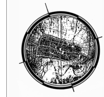
Grafico e Srv. Informativo del Servizio Pianificazione Urbanistica

Spazzate Sassatelli Scala 1:5000 Foglio 02